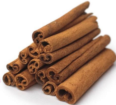
Canela en rama

La canela que todos nosotros conocemos, de color rojo amarillento, olor muy aromático y sabor agradable, se obtiene al raspar la corteza interna de las ramas del canelo o árbol de la canela, el cual es un árbol de hoja perenne , de 10 a 15 metros de altura, procedente de Asia.