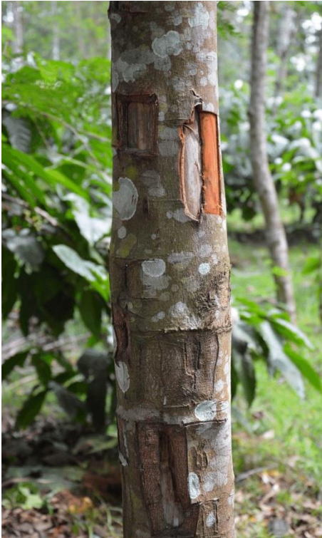
Árbol de canela

sazonar algunos platos. En muchos países es bien conocido su uso en infusiones, y tiene también propiedades medicinales.